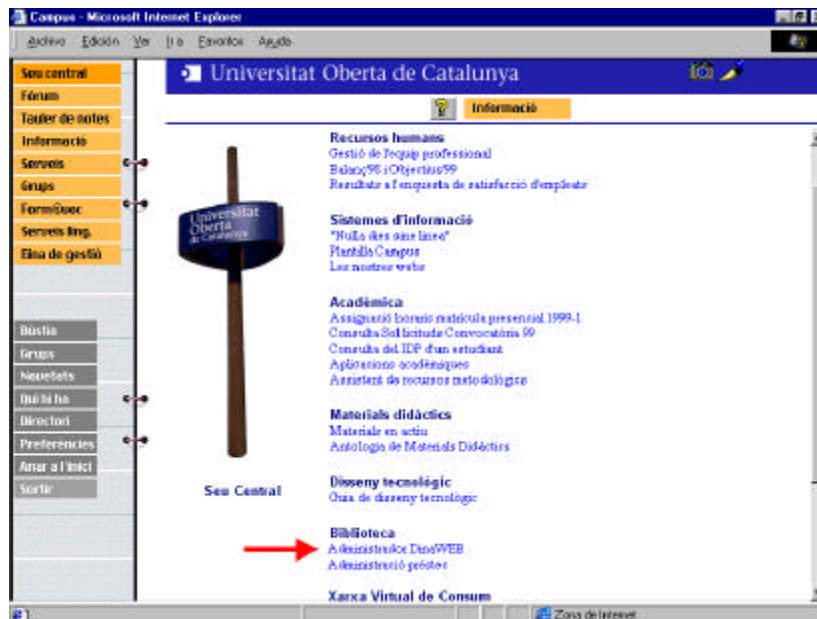
Figura 2. Accés a l'administrador dins el Campus Virtual

L'administració i gestió, és " l'alma mater " del DinaWEB. A la part servidor s'ha determinat que pugui actuar de forma totalment dinàmica, de manera que l'usuari en requerir unes pàgines concretes o uns recursos específics, sigui el propi servidor qui gestioni i interactui amb l'usuari per mostrar-li allò que vol.